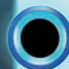
Bouton poussoir UB-One 34-0201